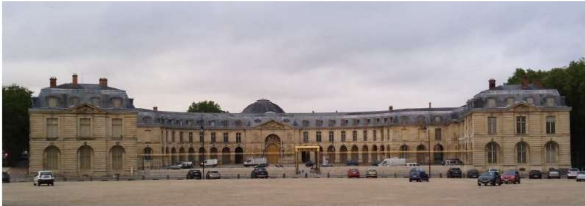
Vue générale depuis la place d'armes du château de Versailles

Les Écuries royales de Versailles (Petite et Grande Écurie) sont sous la responsabilité de l'Établissement public du Musée et du Domaine national de Versailles . La Petite Écurie abrite depuis plusieurs décennies différents établissements partenaires, dont l'École nationale d'architecture de Versailles (l'ENSA-V) . Cet ensemble monumental, construit au XVII e siècle par Jules-Hardouin Mansart, est classé depuis 1862 au titre des monuments historiques et s'insère dans le secteur sauvegardé de Versailles . Au-delà d'une opération courante de restauration d'un monument historique classé dans le respect du dessin et de la matérialité d'origine, le programme du projet financé au titre du plan de relance intègre une forte valeur ajoutée visant l'amélioration des consommations d'énergie de l'édifice pour un gain attendu de près de 55 % par rapport aux consommations actuelles .